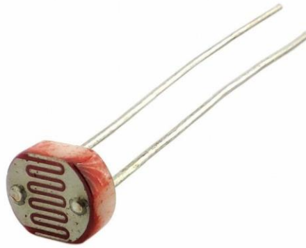
Рисунок 1 – Фоторезистор 50 мм